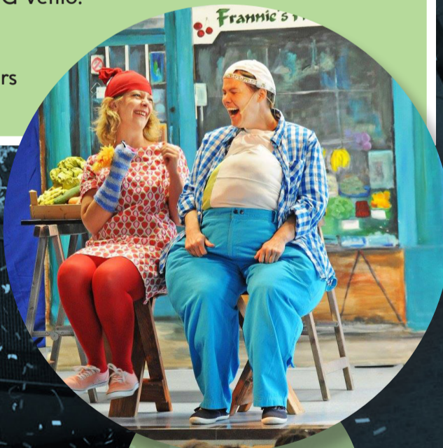
Educatieve Theatervoorstelling 'Amusement'